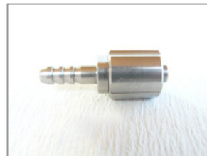
LL männlich Schlauchansatz Ø 4 mm