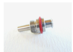
LL weiblich mit Luer Adapter für Veerisnadeln Ring rot (Vomed)