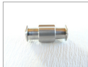
LL 2 x weiblich