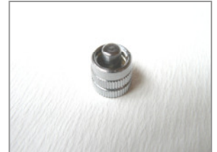
LL männlich Verschlusskappe groß (verchromt)