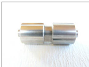
LL 2 x männlich

Metalladapter bestehen aus hochwertigem Edelstahl!