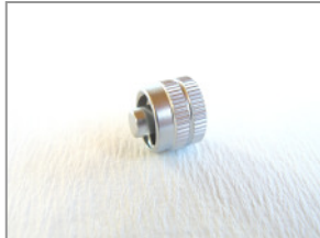
LL männlich Verschlusskappe (verchromt)

Verschlusskappen werden benötigt, um Luer Lock Adapter oder Spülrohre zu verschließen.