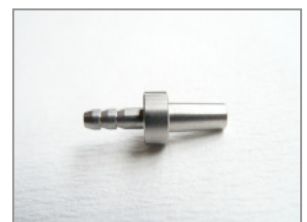
Luer männlich Schlauchansatz Ø 3 mm