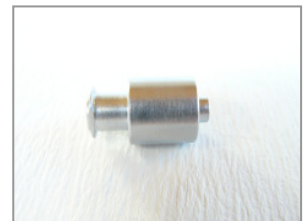
LL männlich/ weiblich (verchromt)