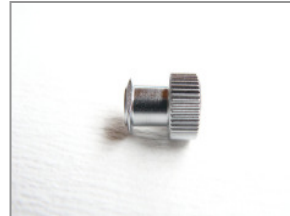
LL weiblich Verschlusskappe (Edelstahl)