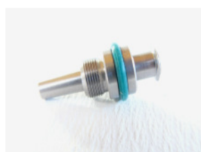
LL weiblich mit Luer Adapter für Veerisnadeln Ring grün (Richard-Wolf)