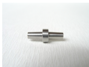
Luer 2 x männlich (Edelstahl)