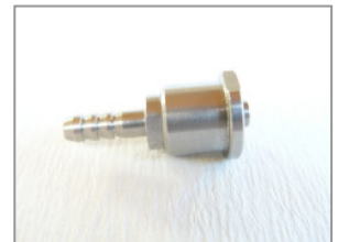
LL männlich Schlauchansatz Ø 4 mm Hülse Ø 10 mm