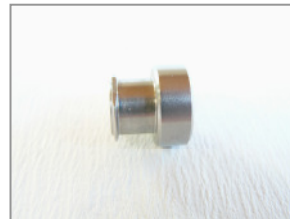
LL weiblich XXL Spüleisten Verschlusskappe (Edelstahl)