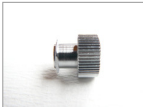
LL weiblich groß Verschlusskappe (verchromt)