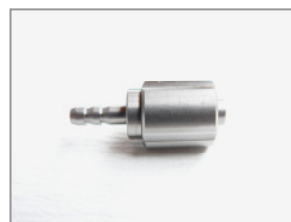
LL männlich Schlauchansatz Ø 3 mm