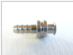
LL weiblich Schlauchansatz Ø 4 mm