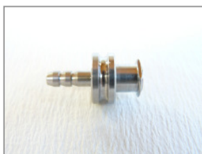
LL weiblich Schlauchansatz Ø 3,0 mm